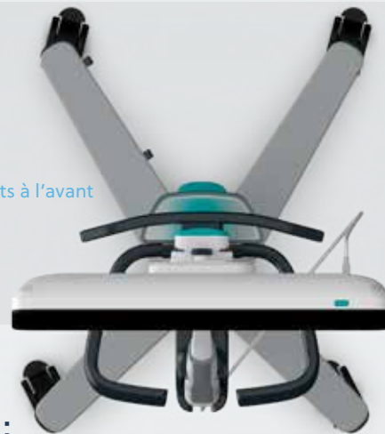
Pieds plus courts à l'avant